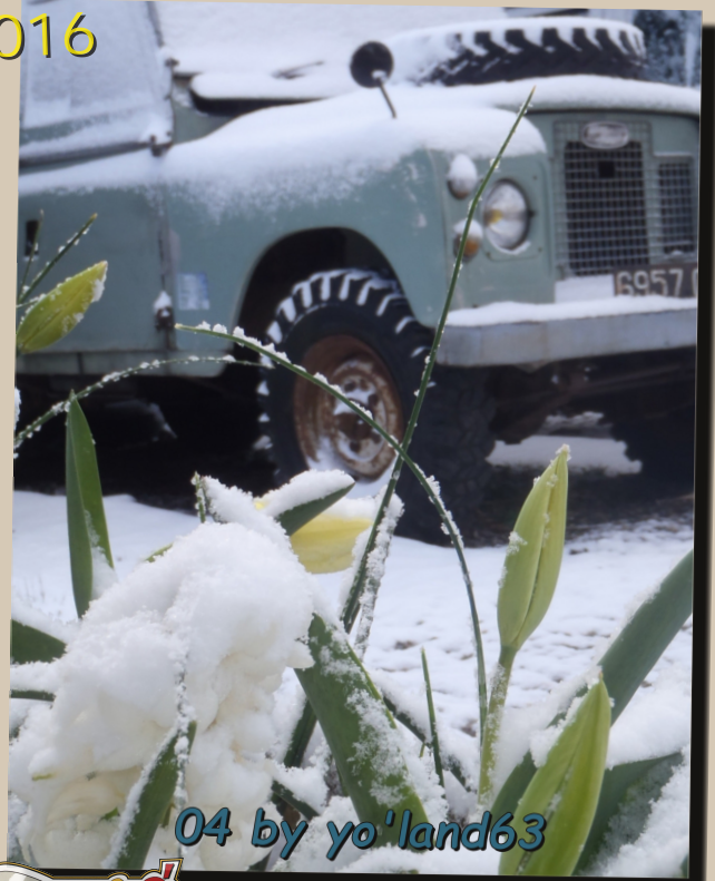
04 by yo'land63