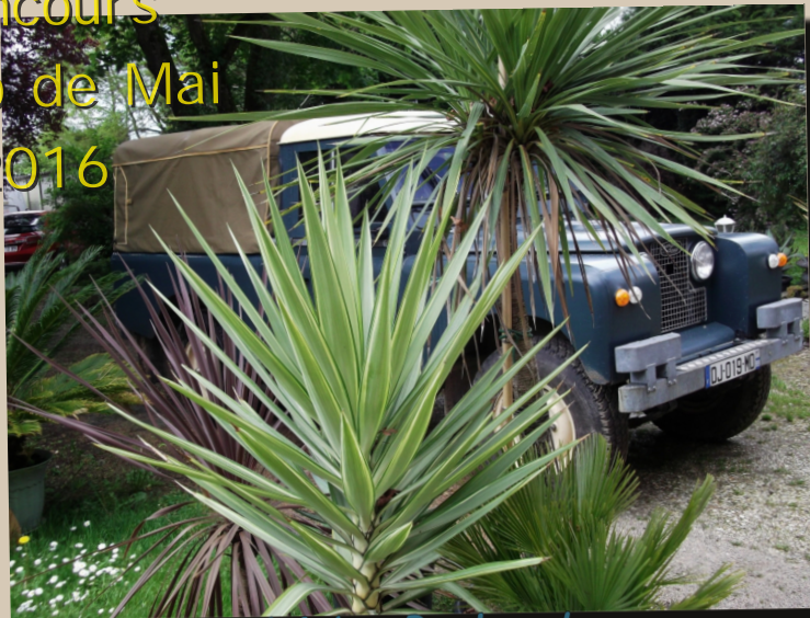
14 by Packard