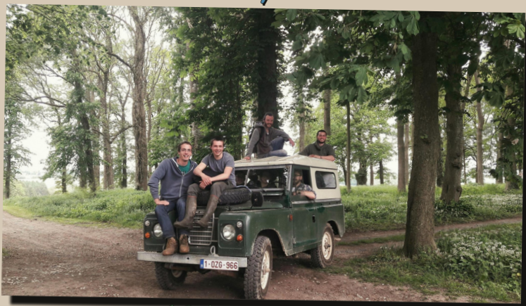
18 by guillaugue