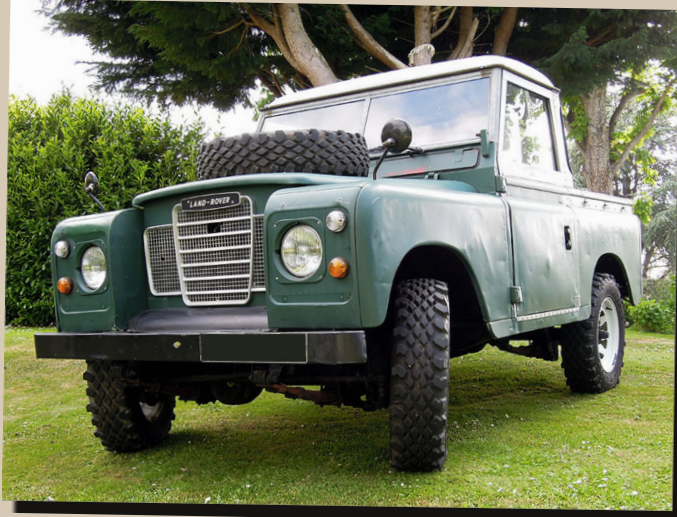
23 by All 2 You