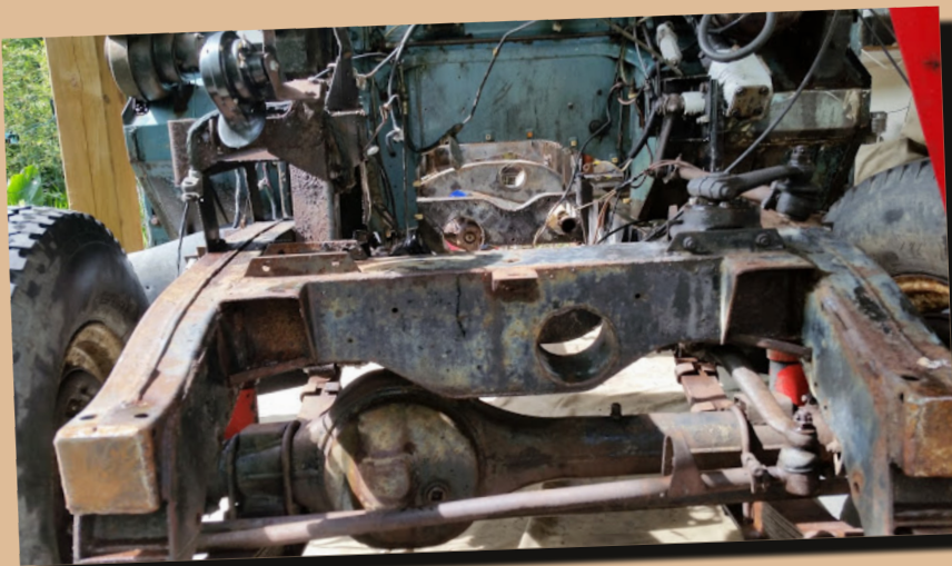
11 by roomone Une que j'aime bien du démontage de Polochon