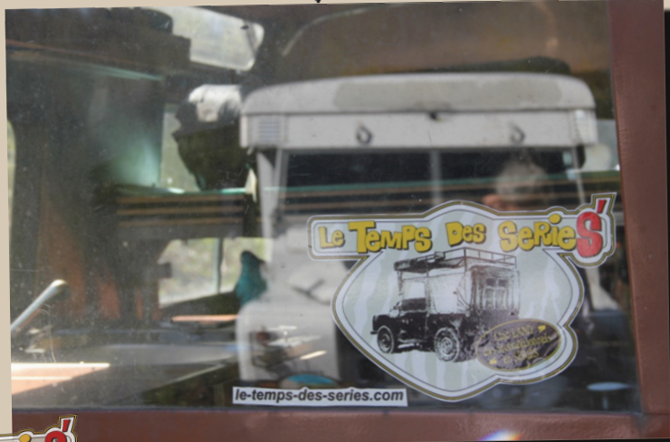
17 by Tiemo