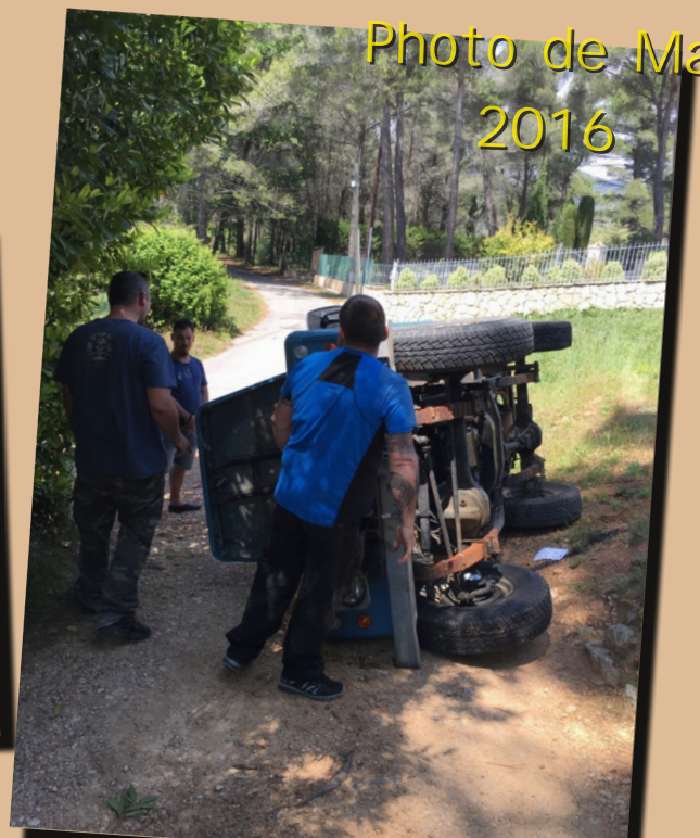
12 by zé06