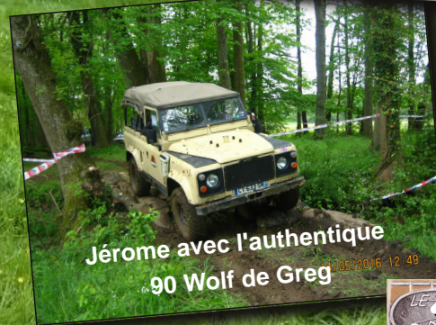
Jérôme avec l'authentique ..90 Wolf de Greg