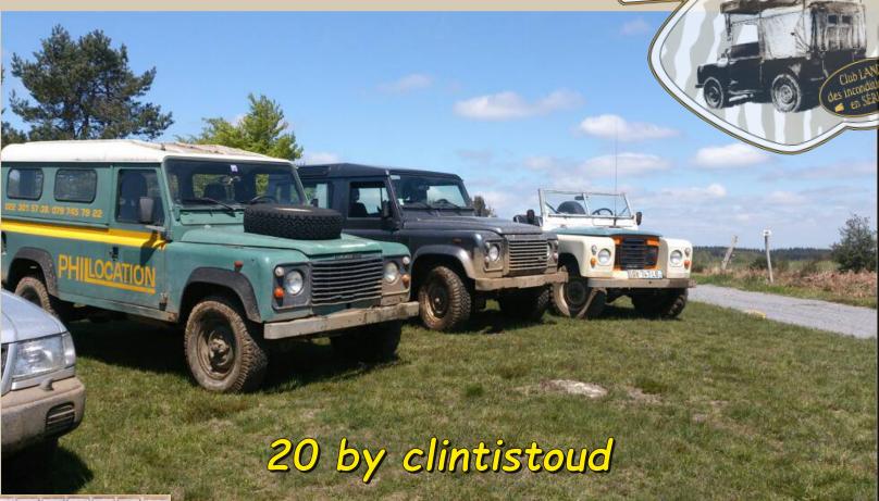
20 by clintistoud