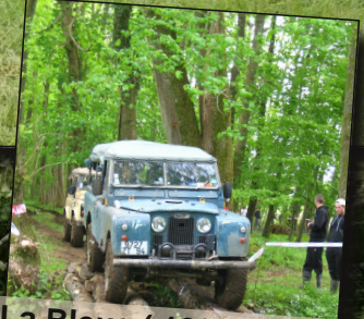
La Bleue ( 109 IIA RHD moteur diesel Isuzu) : ça envoie autrement qu'un Indenor, hein, FirstZident !