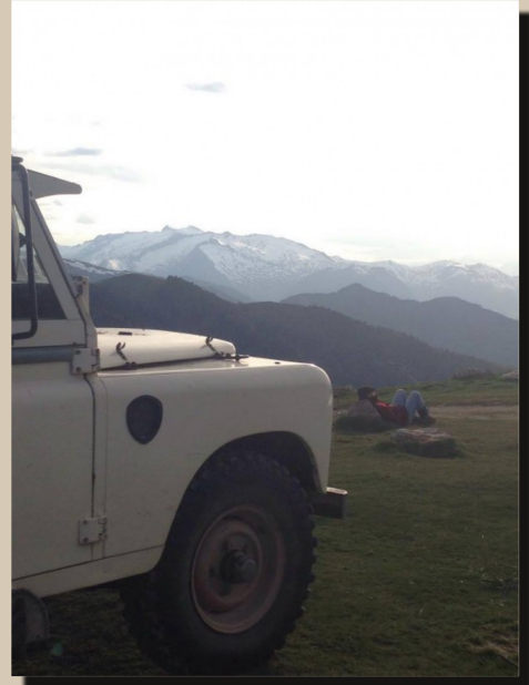
27 by titoc