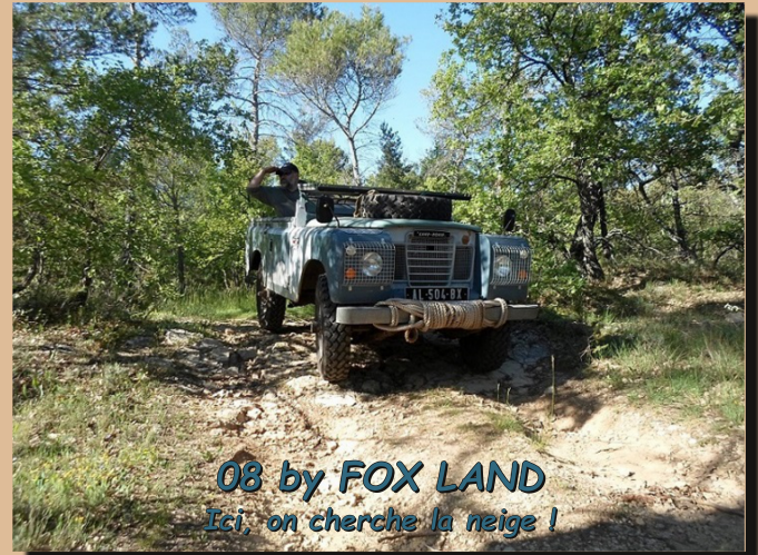
08 by FOX LAND Ici, on cherche la neige !