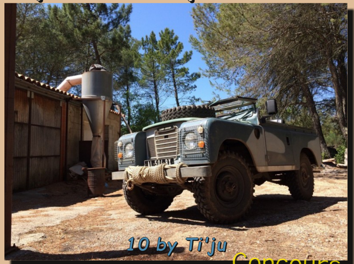
10 by Ti'ju