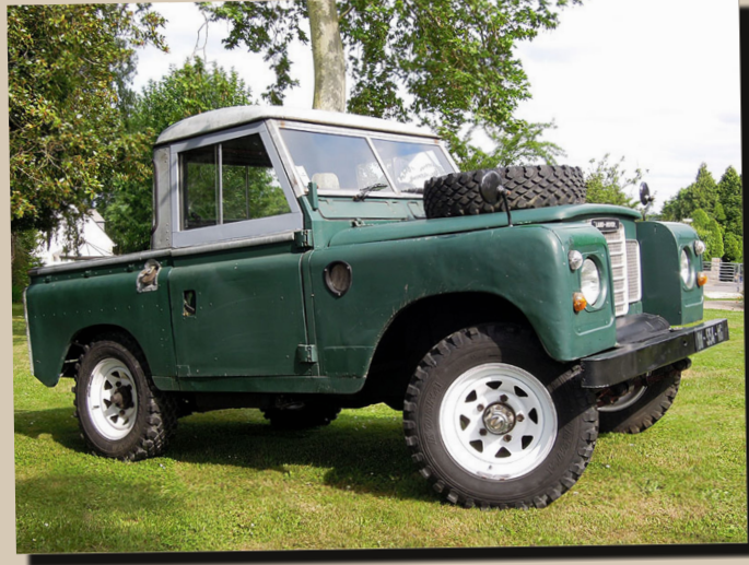
24 by All 2 You