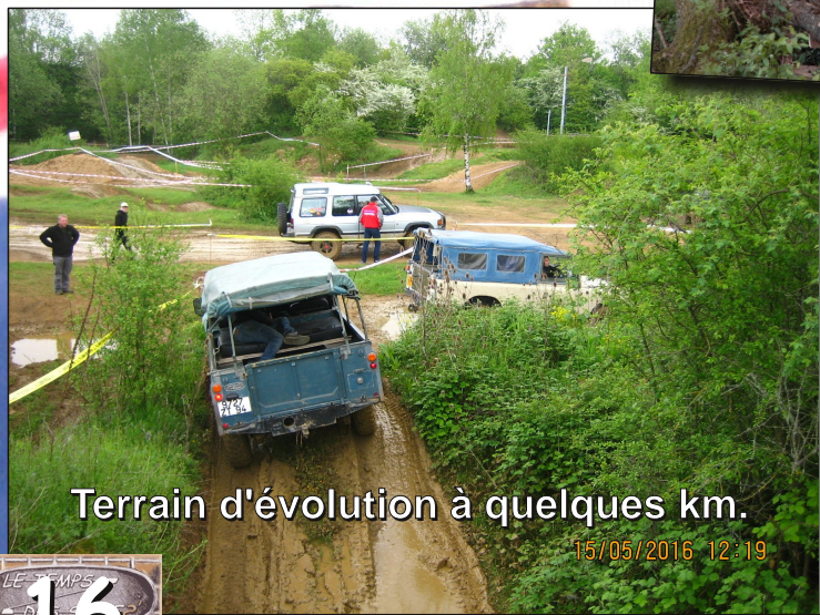
Terrain d'évolution à quelques km.