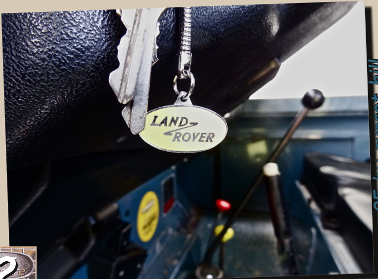
05 by sunset hill