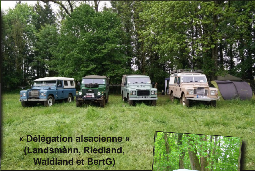
« Délégation alsacienne » (Landsmann, Riedland, Waldland et BertG)