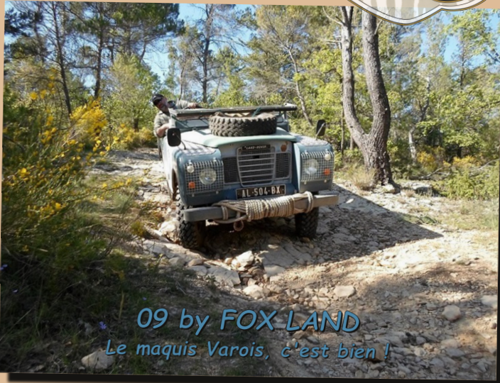
09 by FOX LAND Le maquis Varois, c'est bien !