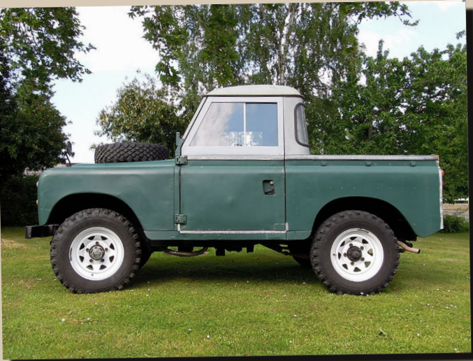
25 by All 2 You