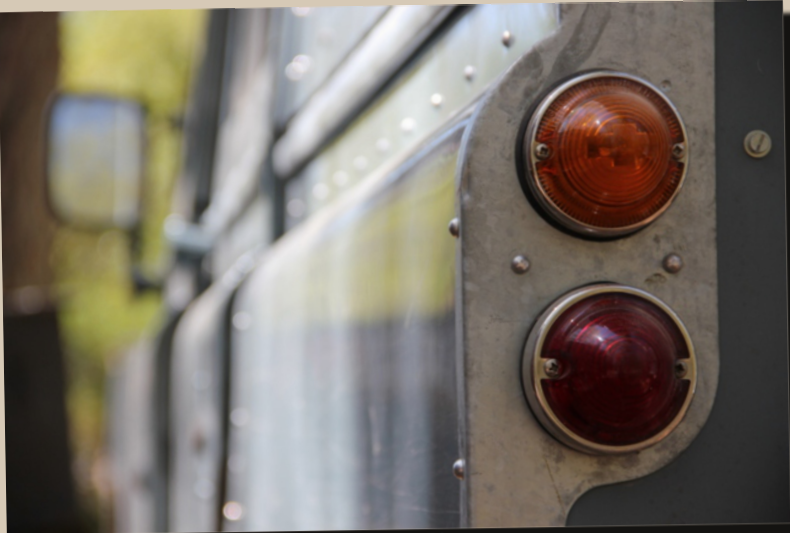
15 by Tiemo