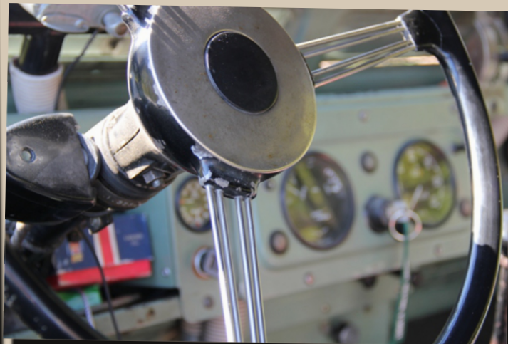
16 by Tiemo