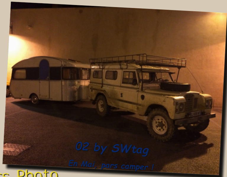
02 by SWtag

En Mai, apprends aux jeunes à s'éclater !