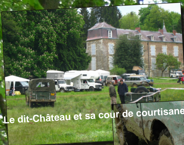
Le dit-Château et sa cour de courtisanes.