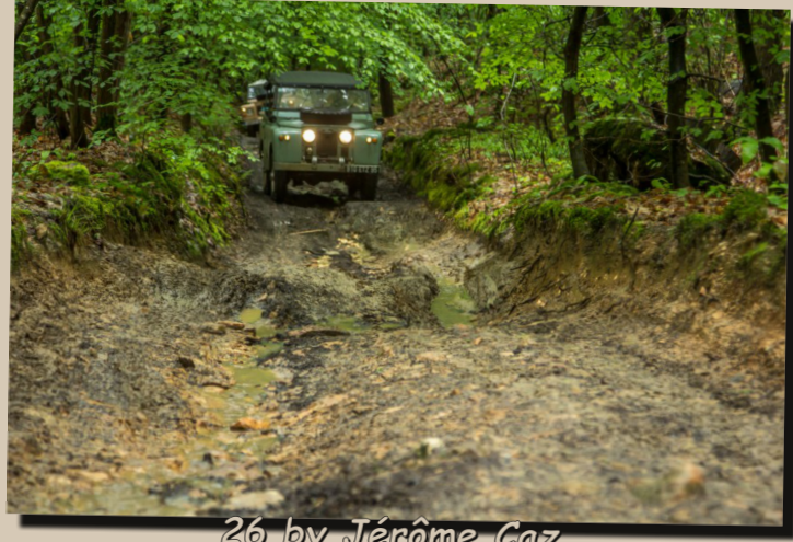
26 by Jérôme Caz.