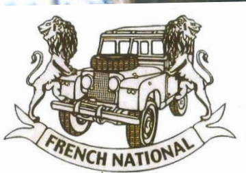
Signy-le-Petit 14-15 Mai 2016

viewtopic : [2016] French National 14-16 mai, 08380 Signy-Le-Petit