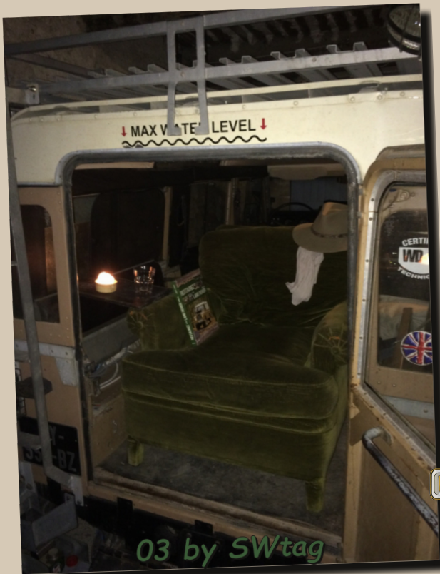
03 by SWtag