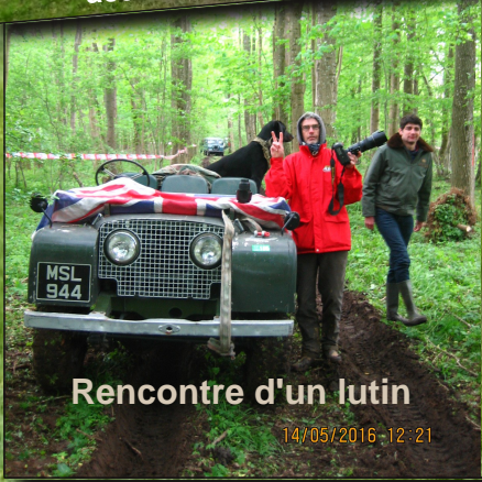
Rencontre d'un lutin