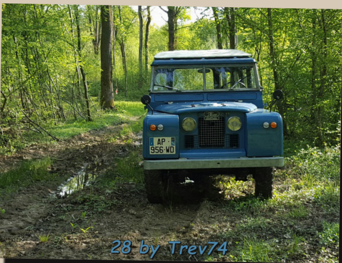
28 by Trev74