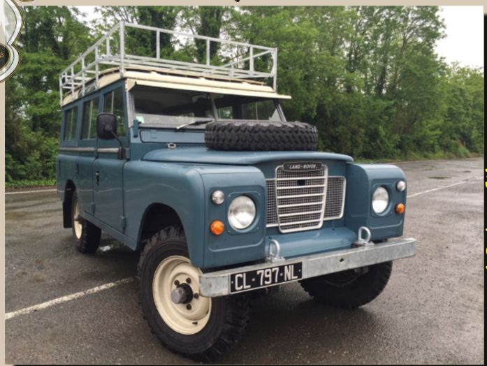
19 by filotent