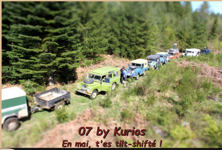
07 by Kurios En mai, t'es tilt-shifté !