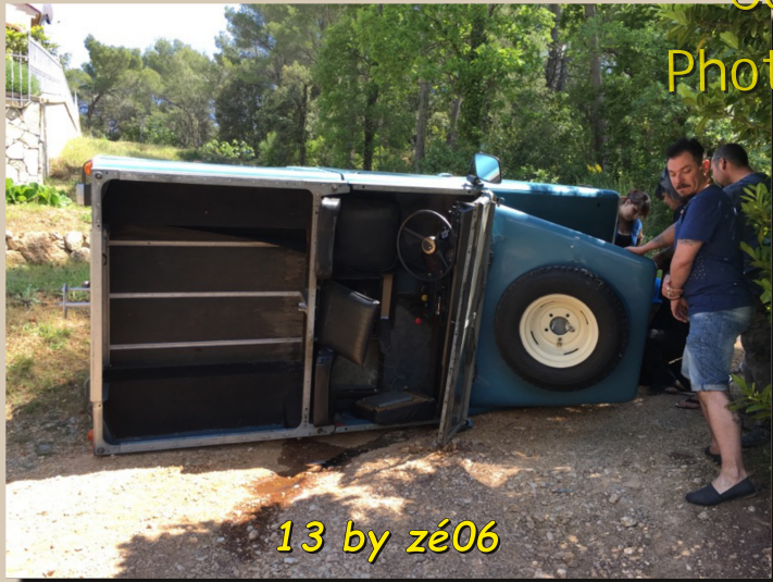
13 by zé06