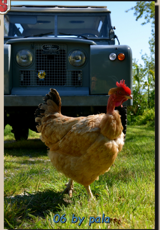
06 by pala