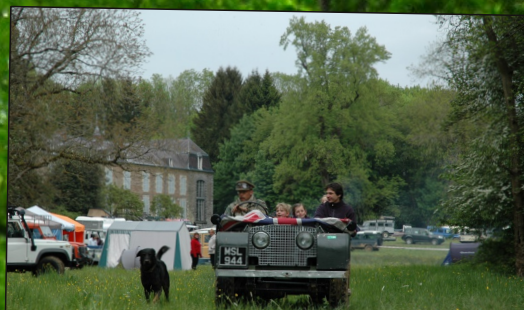
Hâgar, satanas et Cousin Machin