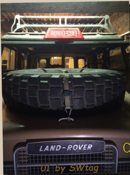
01 by SWtag

En Mai, apprends aux jeunes à s'éclater !