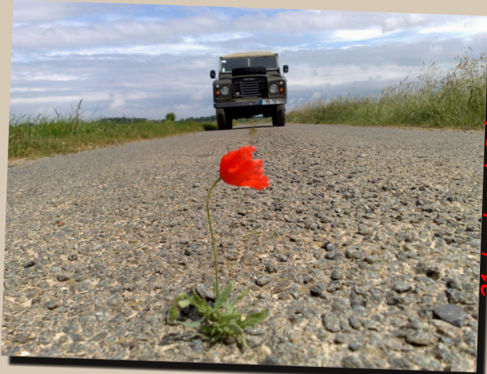
21 by LandRemy