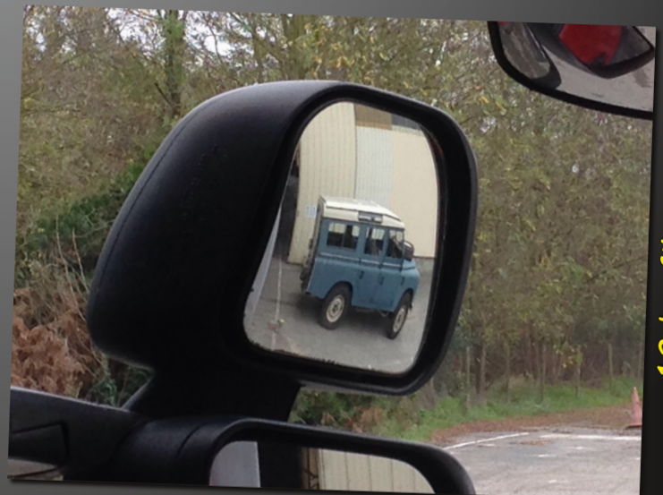
12 by filont