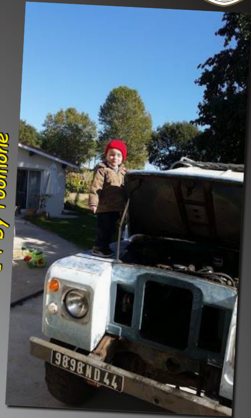
14 by roomone