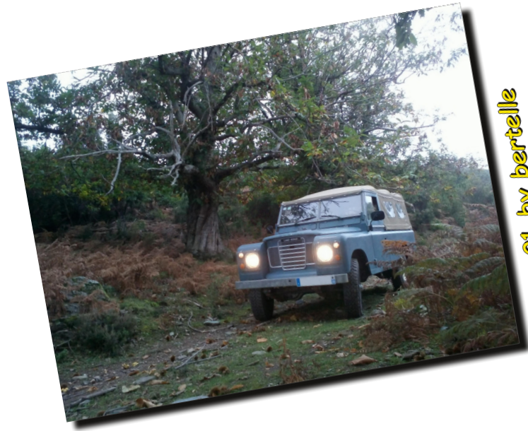
01 by bertelle