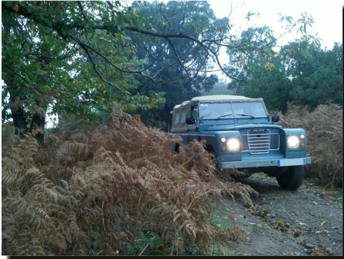
03 by bertelle