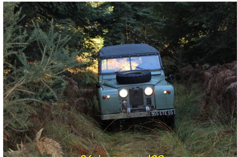
06 by romval29