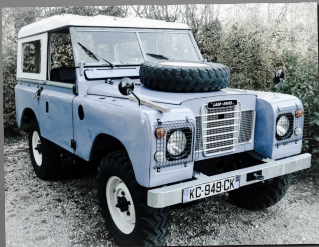
11 by Frederic01