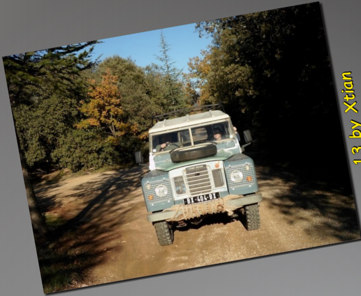
13 by Xtian