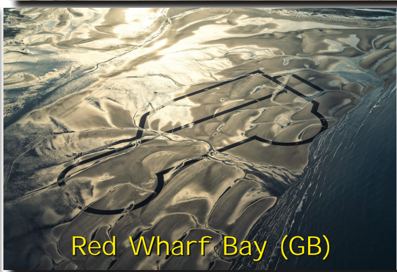
Red Wharf Bay (GB)

Après divers pays d'Europe, Land Rover France a décidé de célébrer également la fin de la construction de son véhicule mythique, débutée en 1948 et qui prend fin en 2015.