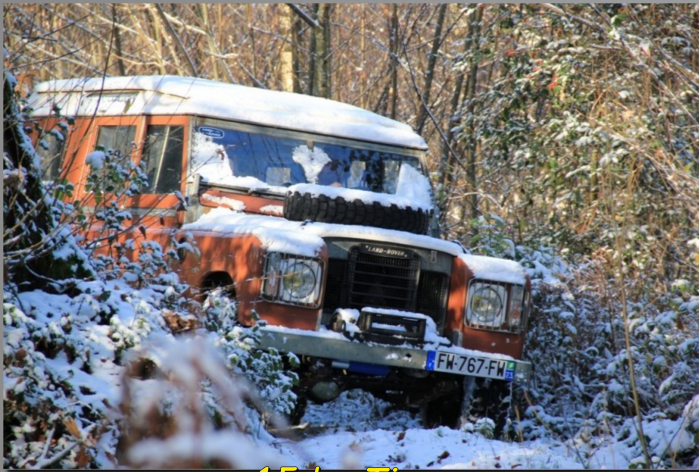
15 by Tiemo