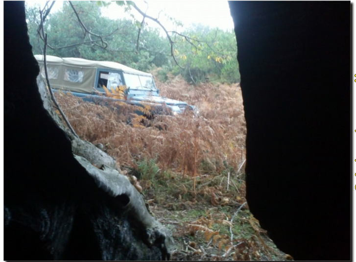
04 by bertelle