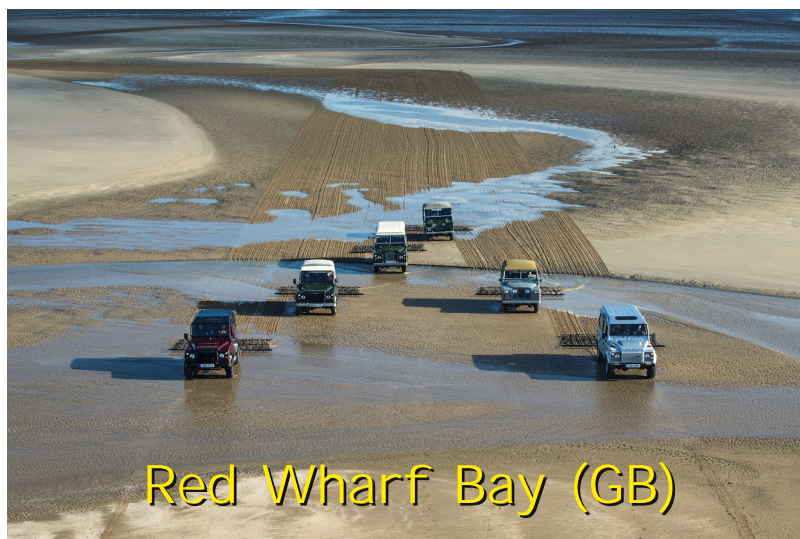
Red Wharf Bay (GB)