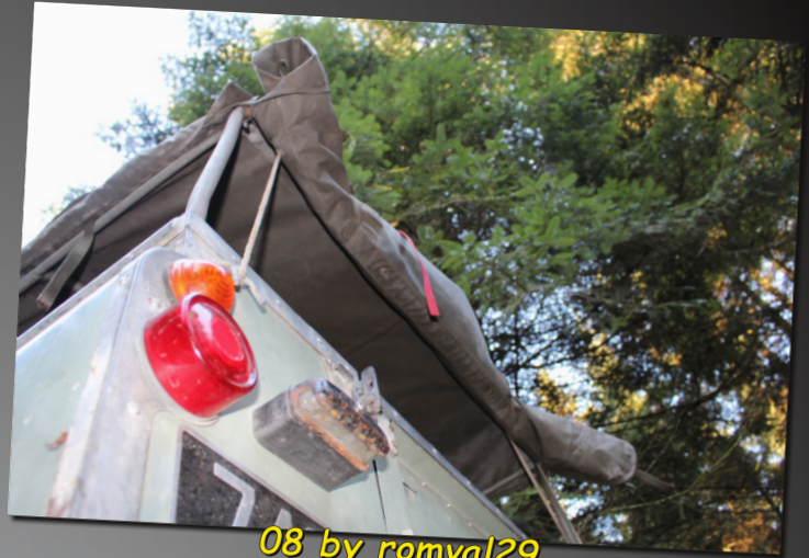
08 by romval29