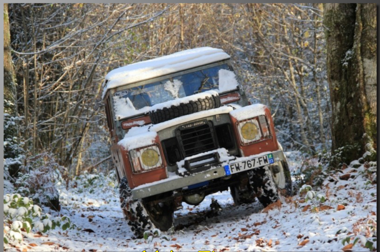
16 by Tiemo