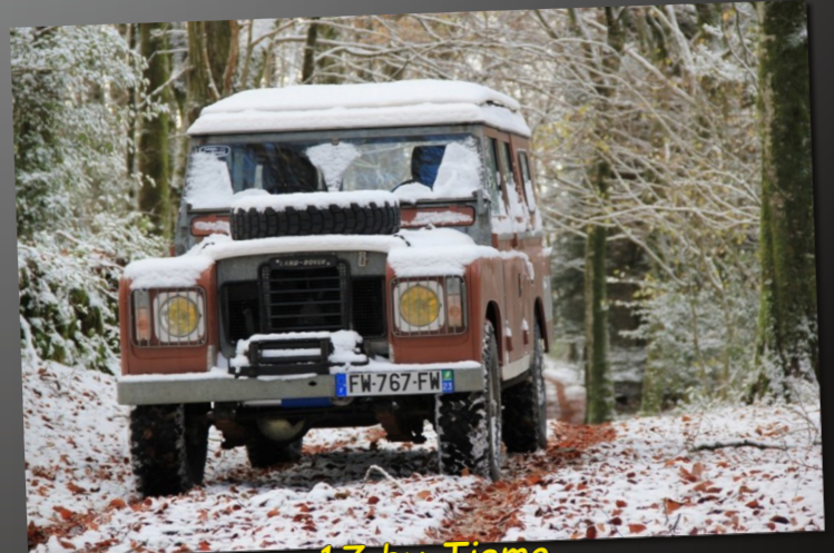
17 by Tiemo