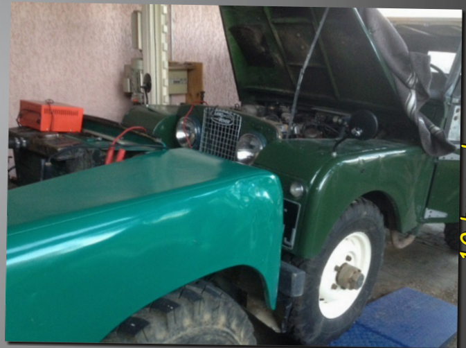
10 by carbone