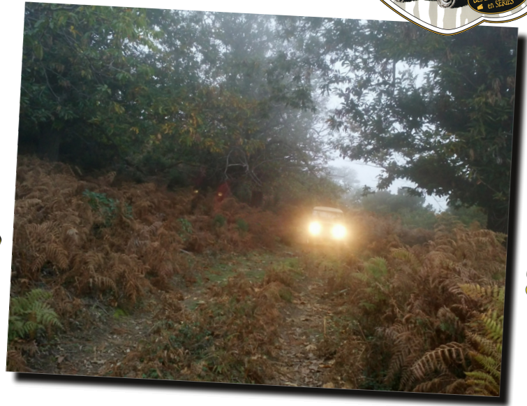
02 by bertelle