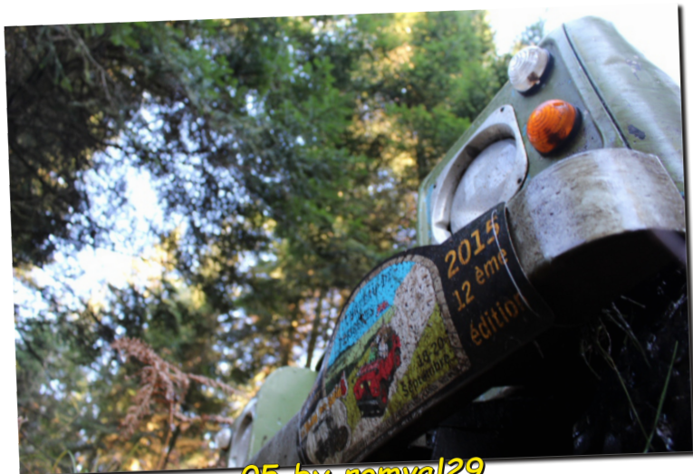
05 by romval29