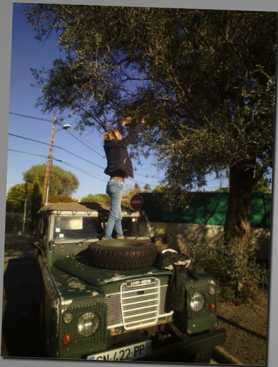
09 by hirohiti2002