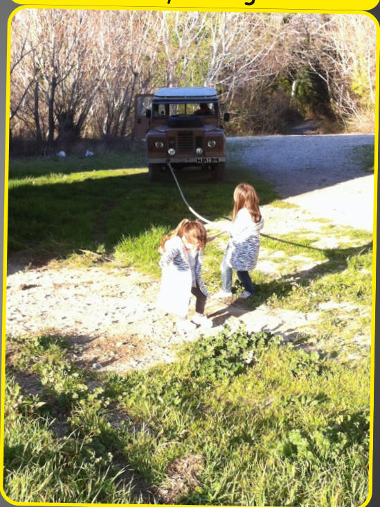
4 by SWtag