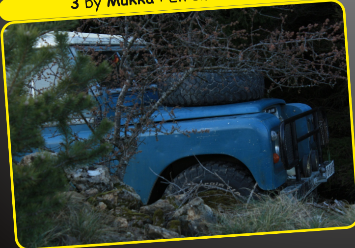
3 by Mukka : En embuscade