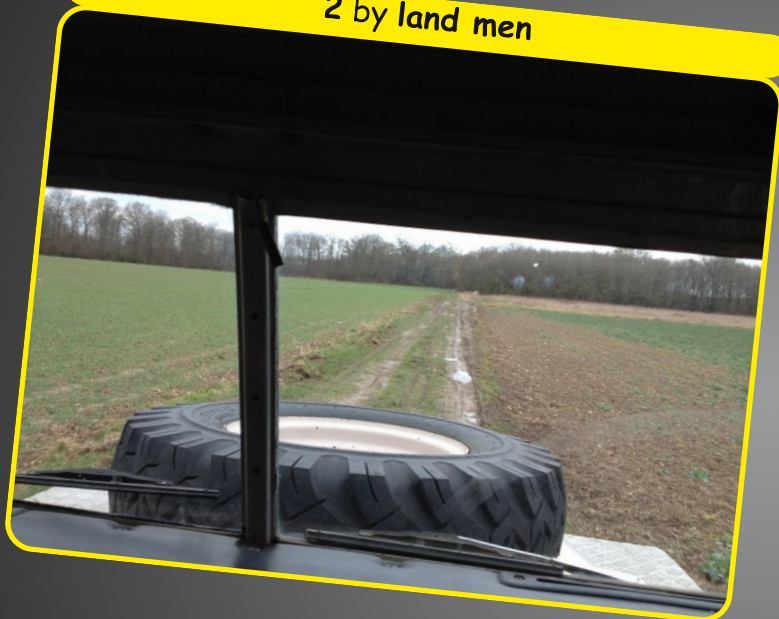
2 by land men