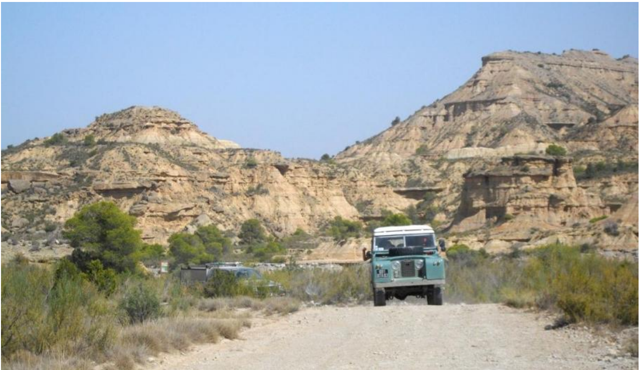
ensuite, des champs à perte de vue et des arrêts fréquents pour faire le point, et s'hydrater.