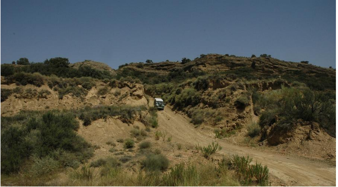
Après Sena, on rentrera dans le vif du sujet... un petit air de Mexique... :